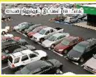
மேலே காட்டப்பட்டவையெல்லாம் விவரத்துக்கான உபயோகிக்கப்படும் படங்களை, உண்மையான படங்கள் வேறுபட்டவையாக இருக்கலாம்.